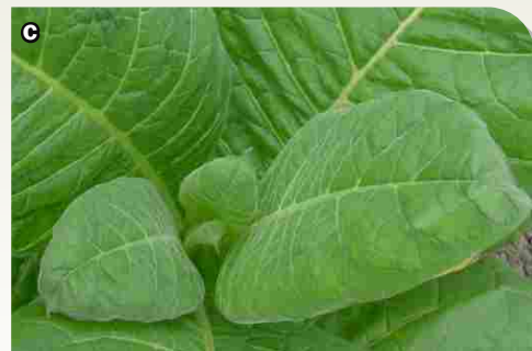
El crecimiento del hongo se interrumpió por la acción secante sobre la pared celular del patógeno.