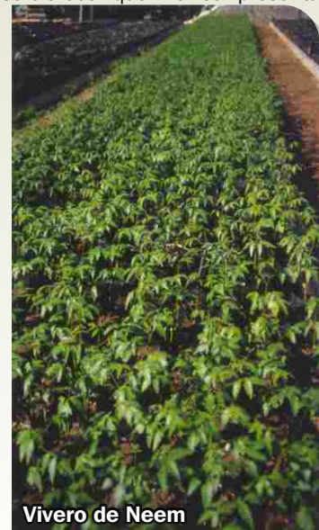
Vivero de Neem