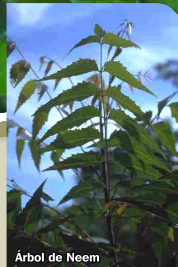
Árbol de Neem

Antes de utilizar el producto en plantas recién transplantadas, en camas de enraizamiento, esquejes, plantas bajo estrés hídrico o con puntos de crecimiento sensibles se corierece que no se presenta sensibilidad aplicando en 2 o 3 plantas. Algunos cultivos pueden presentar sensibilidad después de varias aplicaciones, durante ciertos estados fenológicos o cuando se encuentran bajo estrés hídrico. Antes de fumigar extensivamente, aplique el producto en una superficie menor y observe si las hojas o flores presentan sensibilidad. Si se presenta marchitez después de 2 a 3 horas de aplicar el producto, lave el follaje con agua limpia y reduzca la dosis, diluyendo más el producto antes de aplicar nuevamente. Evite asperjar el producto cuando observe insectos polinizadores trabajando ya que es nocivo para las abejas si entra en contacto directo con estas.