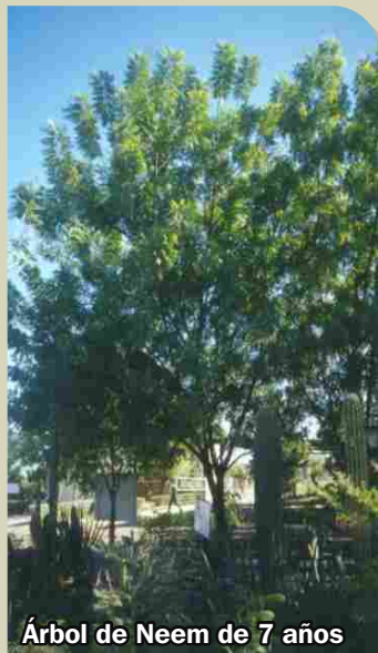
Árbol de Neem de 7 años

PHC® NEEEM® debe aplicarse cuando hay presencia de huevecillos, larvas o adultos, mojando bien el envez de las hojas y asegurando que el producto entre en contacto con estos. Repita la primera aplicación a los 2-3 días. Si es necesario, repita 2 o 3 aplicaciones más a intervalos de 10 a 15 días hasta el momento de la cosecha.