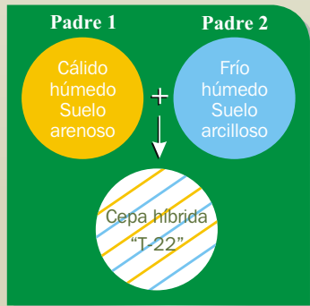
Figura 1. Cruza de 2 cepas T. harzianum , por fusión de protoplastos

La Cepa T-22 ha sido desarrollada por la Universidad de Cornell mediante una cruce de dos cepas de Trichoderma harzianum provenientes de regiones de climas y suelos contrastantes (Figura 1), lo cual le confiere propiedades sobresalientes de adaptación a un amplio rango de especies (probada en más de 2000 especies de plantas silvestres y cultivadas), suelos (de arenosos a arcillosos), climas (fríos-templados y cálido húmedos) y pHs (4-8).