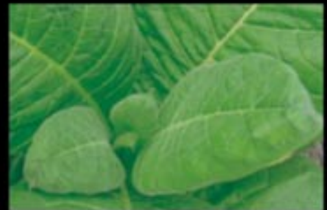
El crecimiento del hongo se interrumpió por la acción secante sobre la pared celular del patógeno.