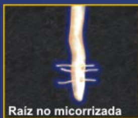
Raíz no micorrizada

Todas las ventajas de PHC® Endo-Rhyza® Mini Plug , lo han hecho partícipe en la fertilidad de la economía de cientos de Productores Agrícolas del País, mismos que hoy han instituido en sus cultivos una producción de calidad total y por lo tanto, han MAXIMIZADO sus utilidades.